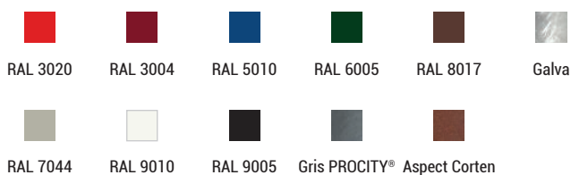
Réf. 529451 + 529455