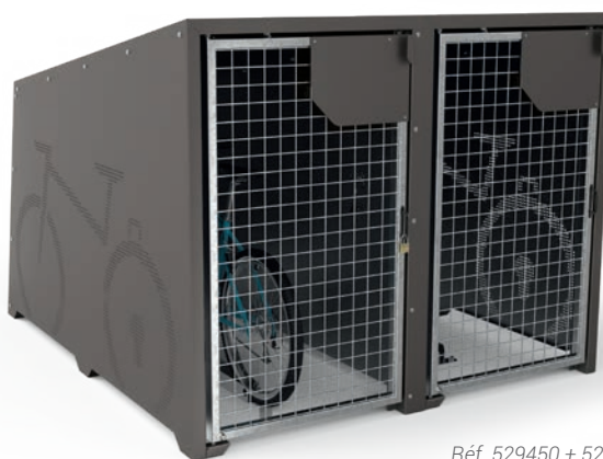
Réf. 529450 + 529454 + 529455